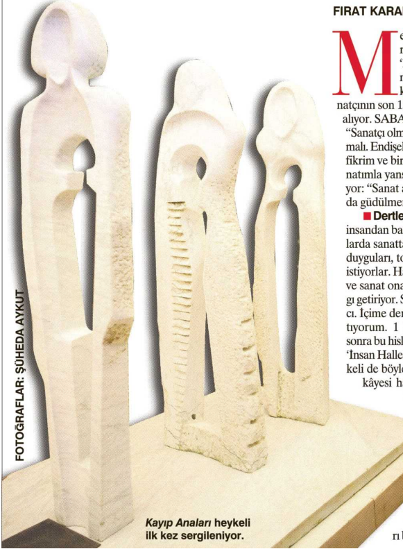
Kayıp Anaları heykeli ilk kez sergileniyor.